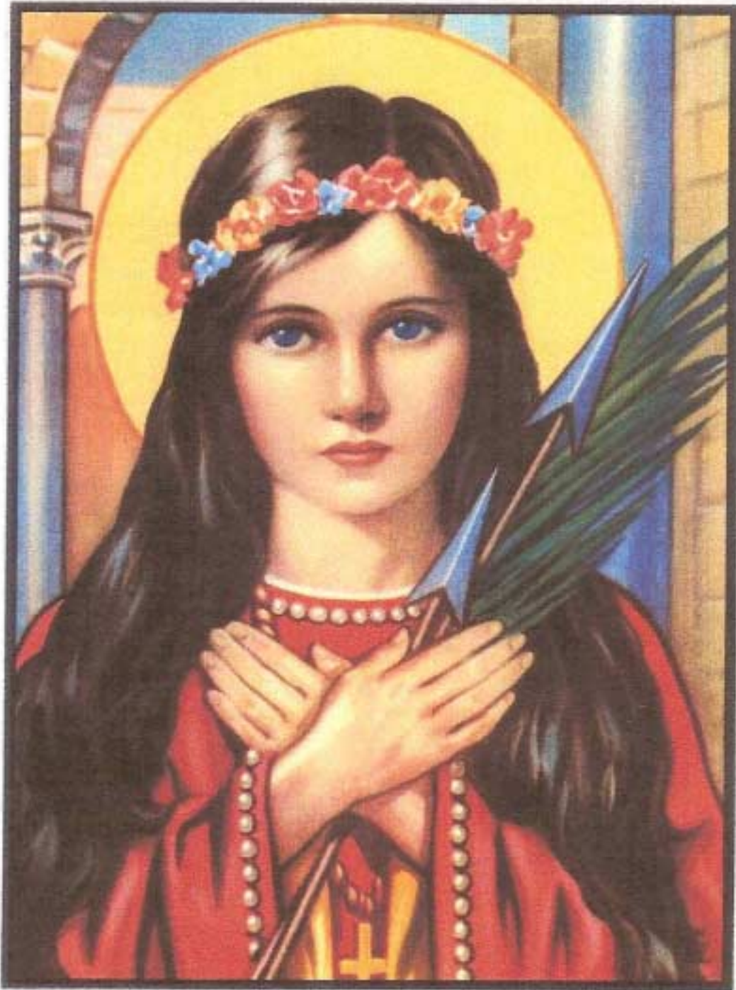
F5rt v (Tagalog)