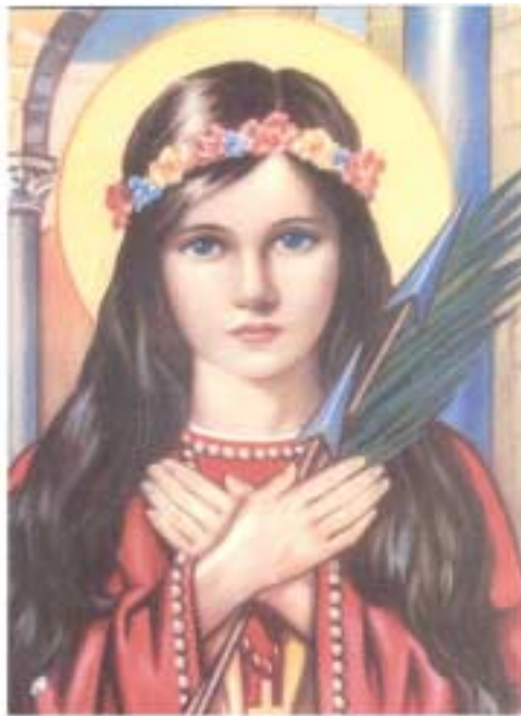
Novena Oração à Santa Filomena Portugues